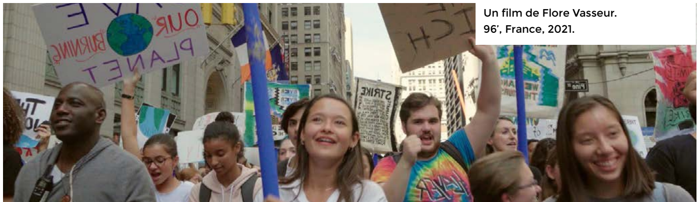
Un film de Flore Vasseur. 96', France, 2021.

Contactez-nous par e-mail : elsa@lavenerie.be